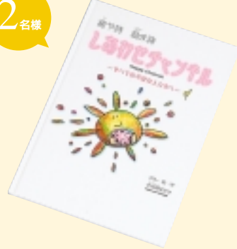
④あわせチャンネル 小鳥遊 ほだかさん 著