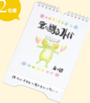
②君に贈るコバ 来々留さん 著