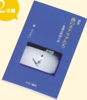
①夜のカナリアたち 森 ぶんめいさん 著