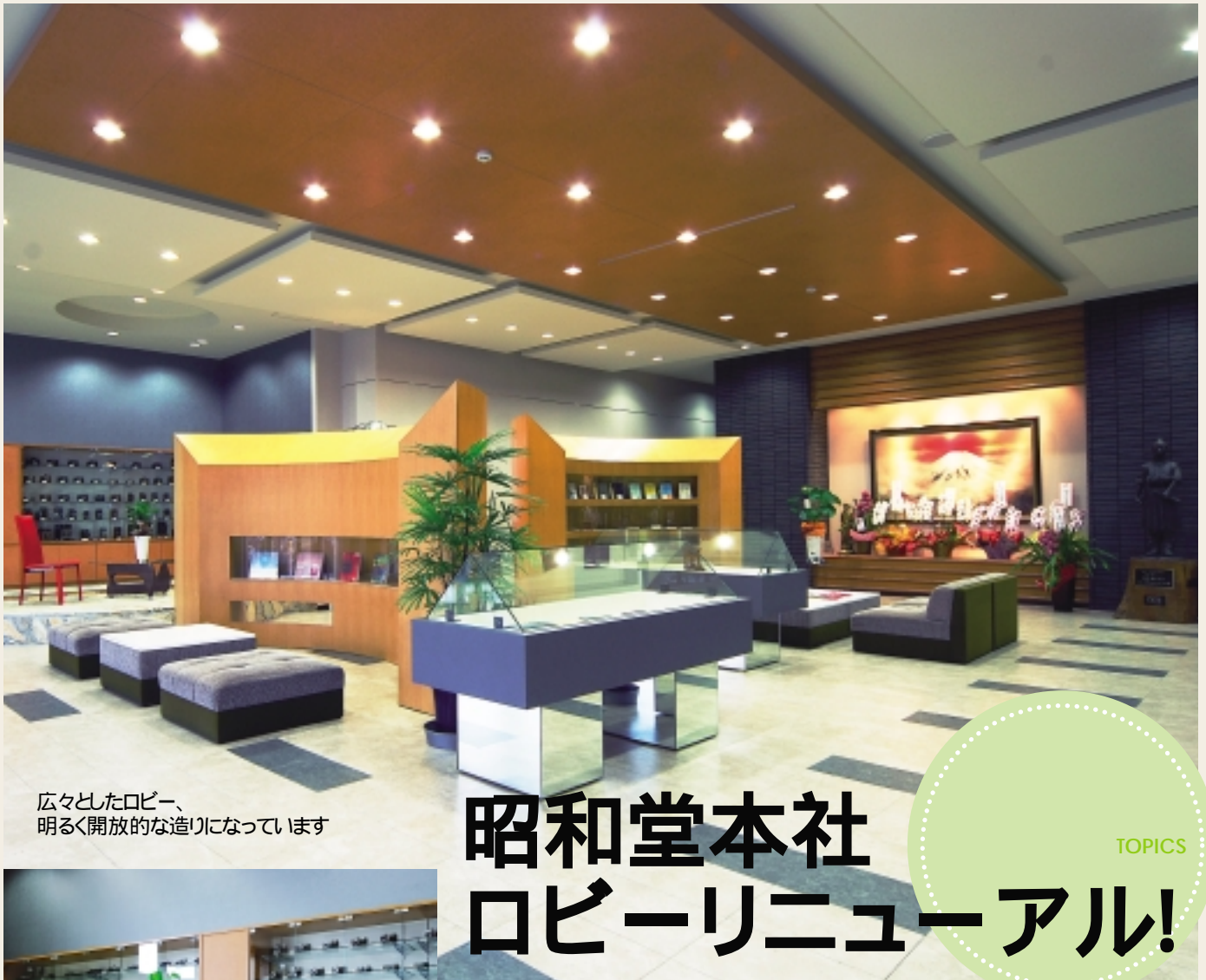
広々としたロビー、 明るく開放的な造りになっています