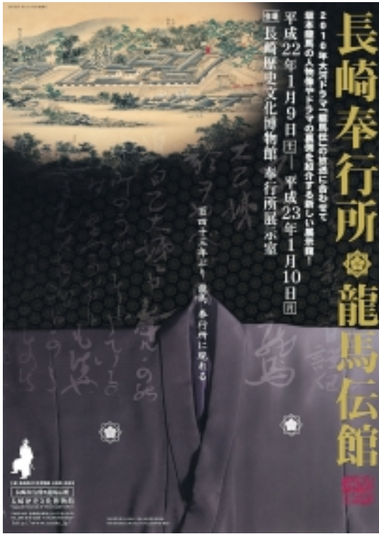
歴史文化展示ゾーン 貿易都市長崎 長崎のお正月 イベントの間 立山亭 長崎奉行所 龍馬伝館 長崎奉行所ゾーン ライデン国立民族学博物館コレクション「シーボルトと仏教」 歴史文化展示ゾーン 中国との交流 伝統工芸 貸工房 長崎べっ甲