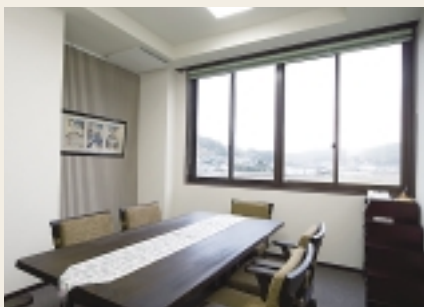
“元気” “前向き” “笑顔”と それぞれ名付けてある応接室