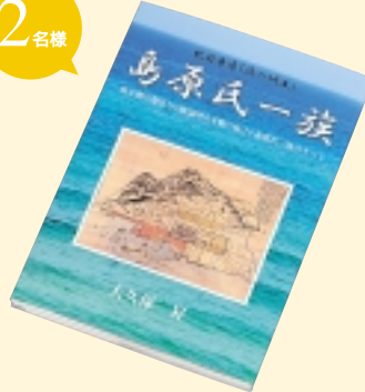
③島原氏一族 大久保 昇さん 著