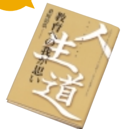
④ 人生道 - 教育への我が思い - 桑原清弘さん著