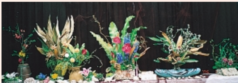
生け花展に出品「海の詩」