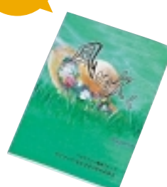
③ 風が吹く ワクワーク・ながさき編