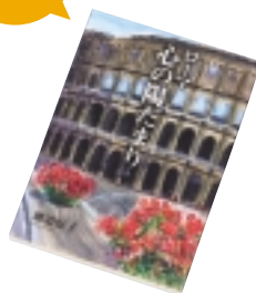
② ローマ 心の陽だまり 磯道保子さん著